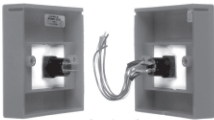
Rear views of: a terminated model - right and a non-terminated model - left.

A dimensioned side view of a Miniature Push Button model.